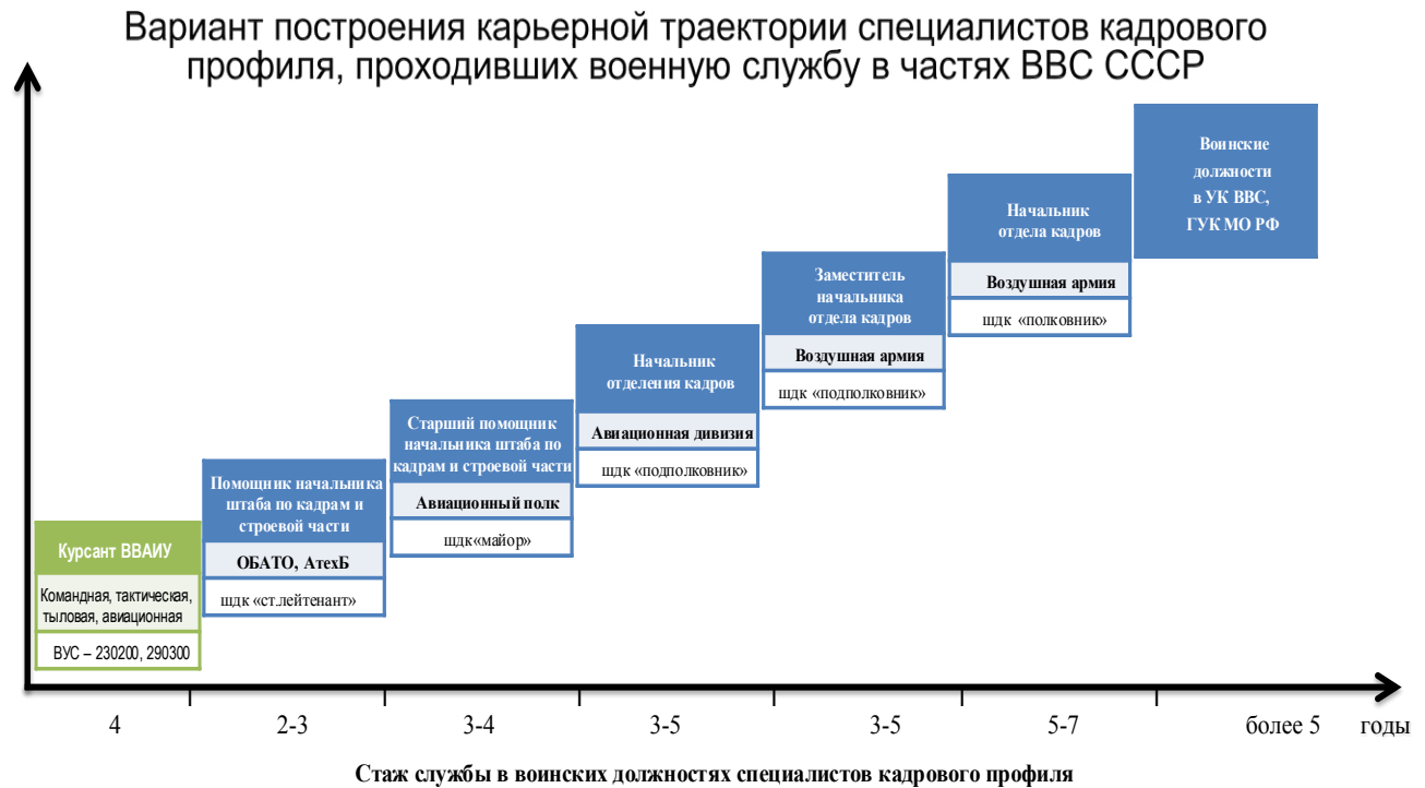
Рисунок 1 – Карьерограмма специалистов кадровых органов, проходивших военную службу в частях ВВС СССР

на воинских должностях, связанных с кадровой работой в воинских частях, соединениях и объединениях ВВС.