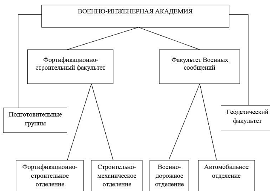
Рисунок 3 – Основные структурные подразделения академии